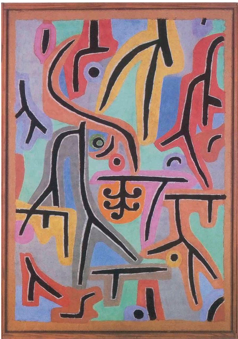
Paul Klee: Park nær Lu (Lucerne) 1938